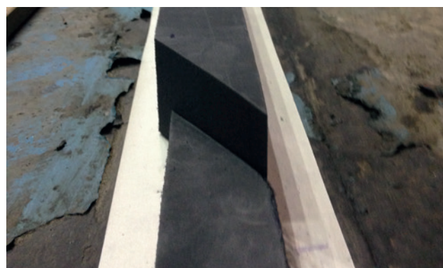
Bezpečné spojení profilů díky zkoseným řezům s úhlem 60°