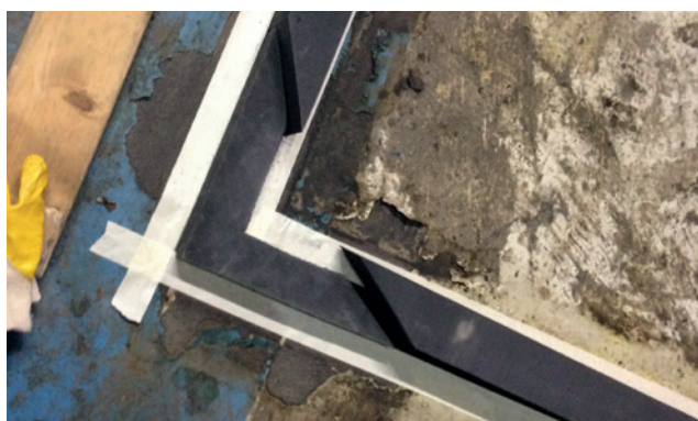
Napojení rovného profilu k úhlovému profilu